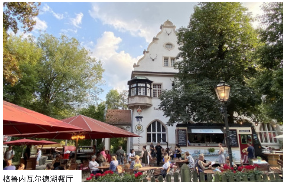
格鲁内瓦尔德湖餐厅