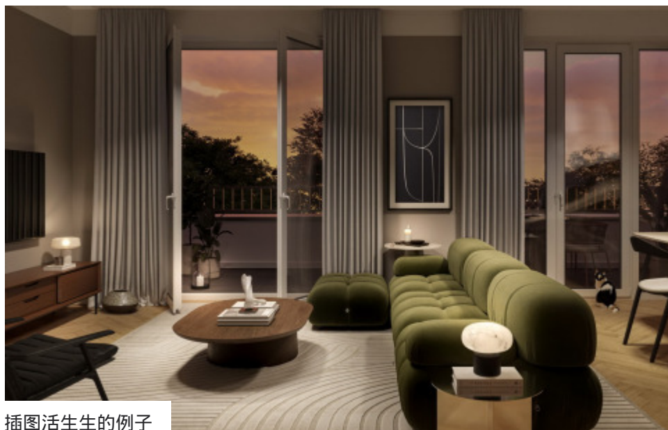
插图活生生的例子