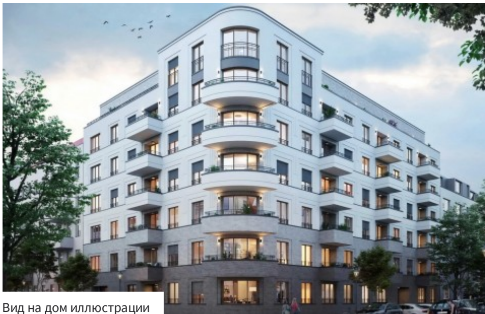
Вид на дом иллюстрации