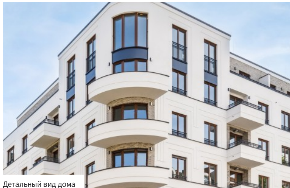
Детальный вид дома