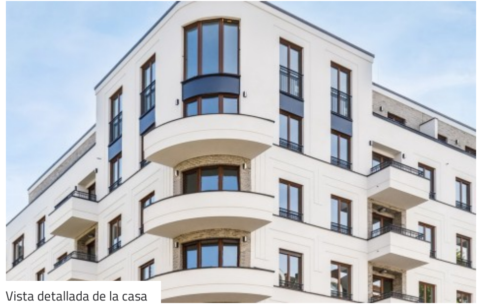
Vista detallada de la casa