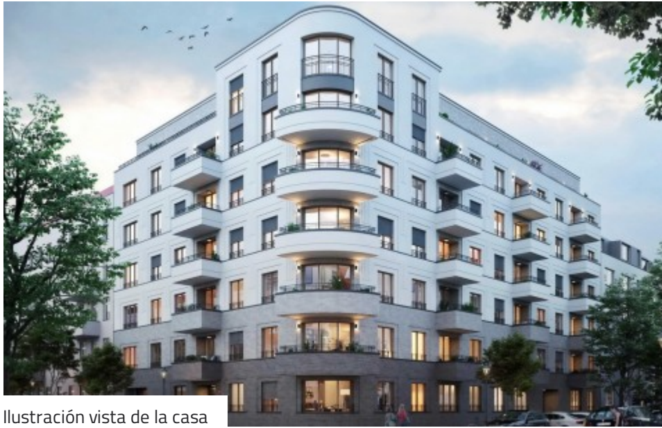
Ilustración vista de la casa