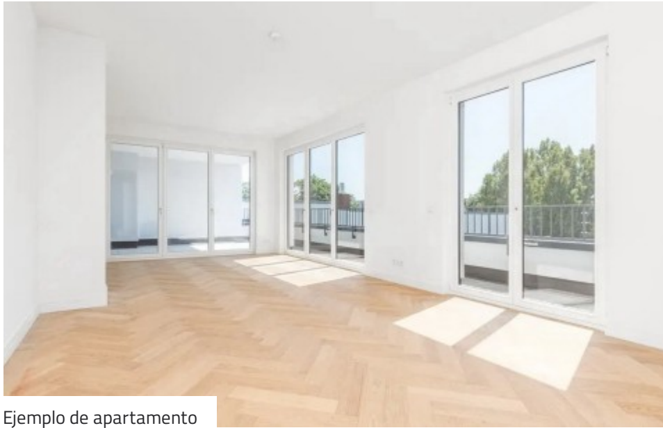
Ejemplo de apartamento