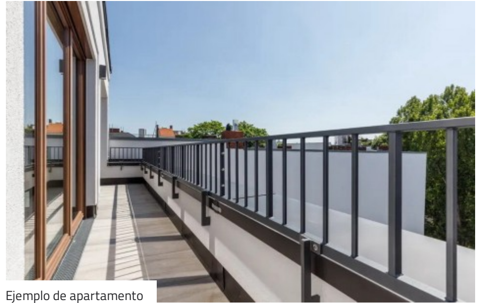
Ejemplo de apartamento