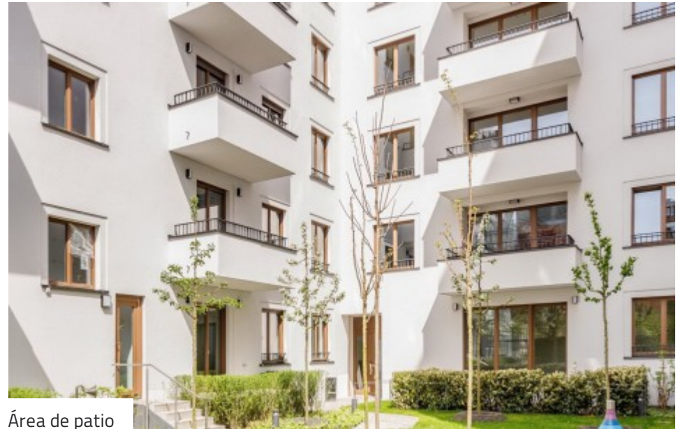
Área de patio