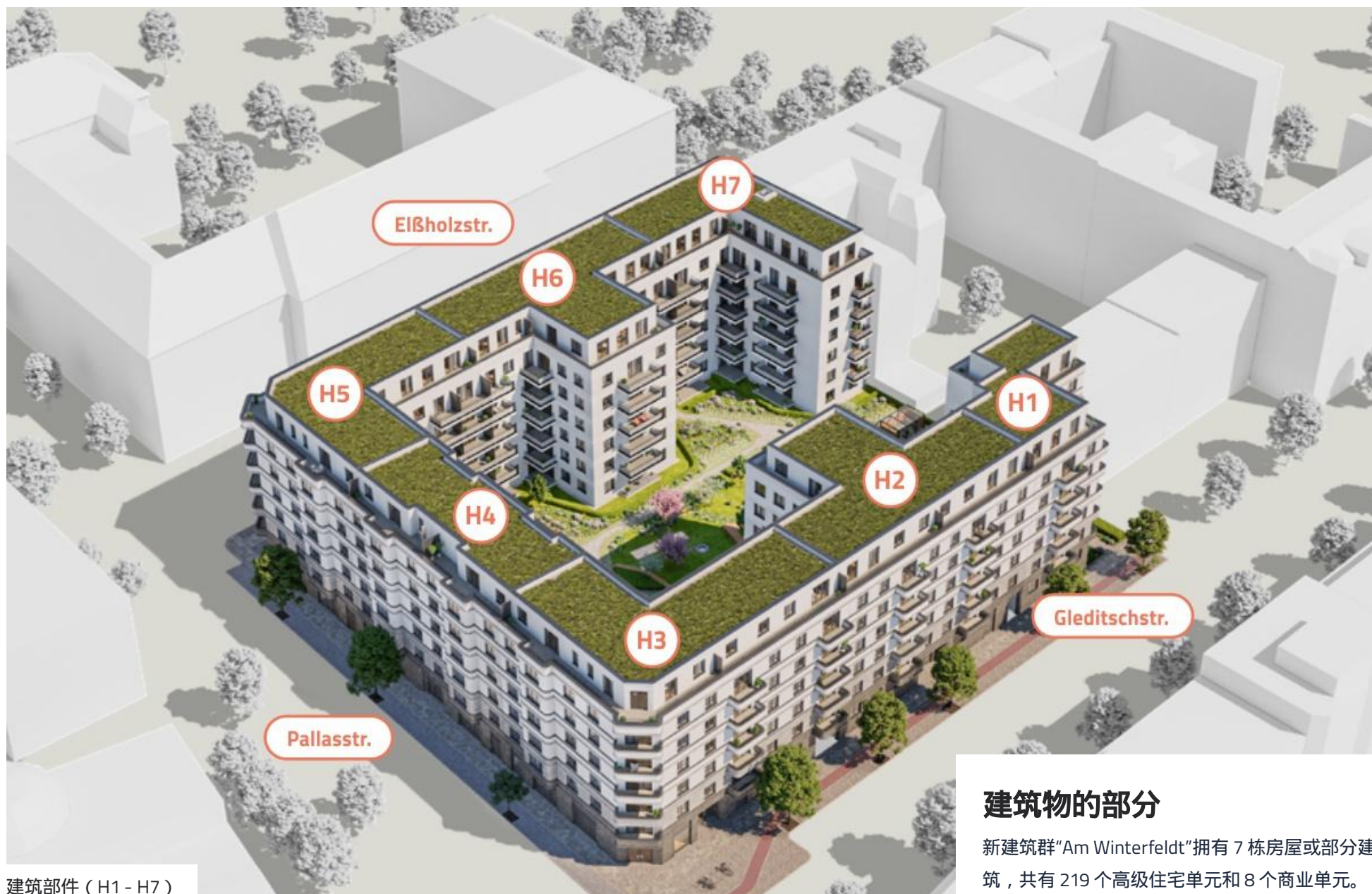
建筑部件 (H1 - H7)