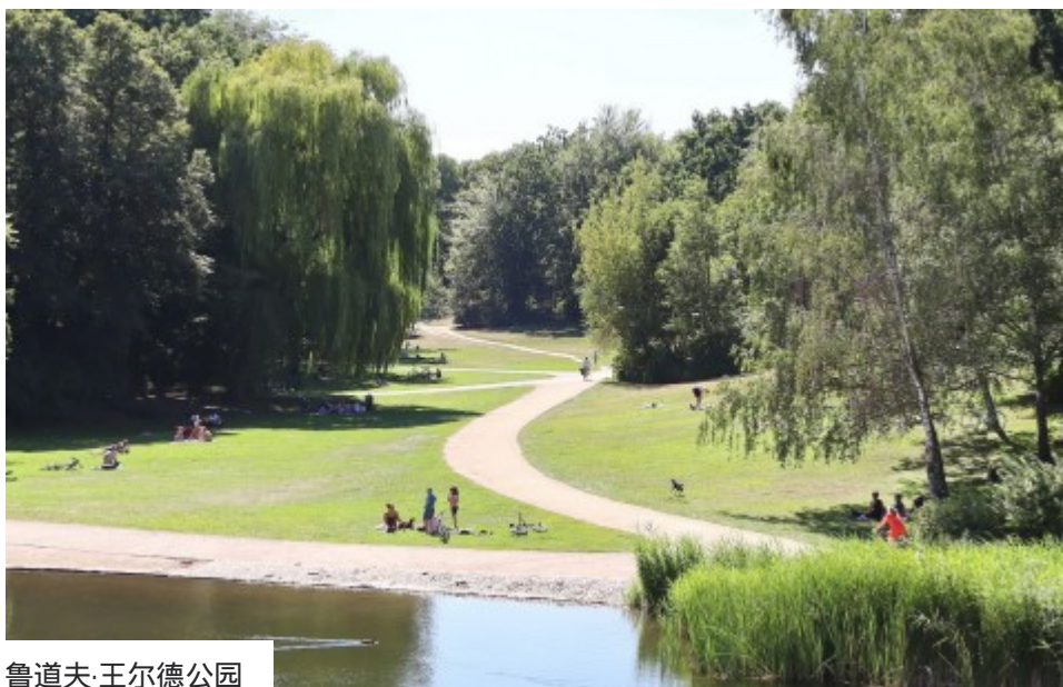
鲁道夫·沃尔德公园