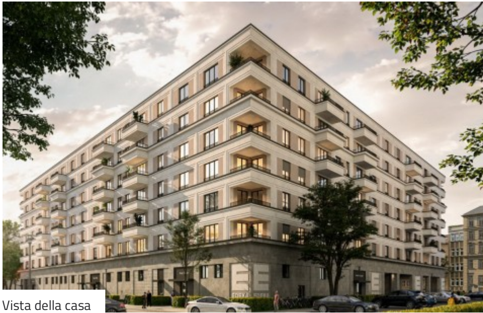
Vista della casa