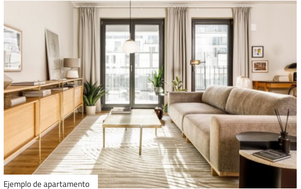
Ejemplo de apartamento