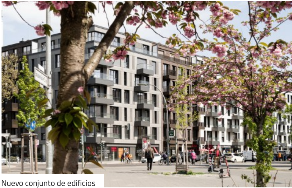
Nuevo conjunto de edificios