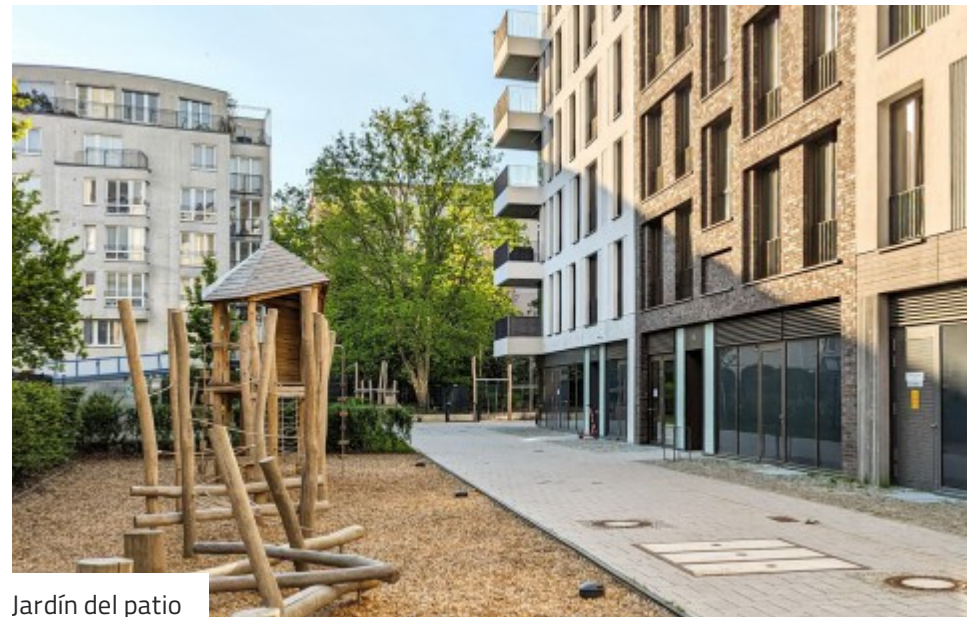
Jardín del patio