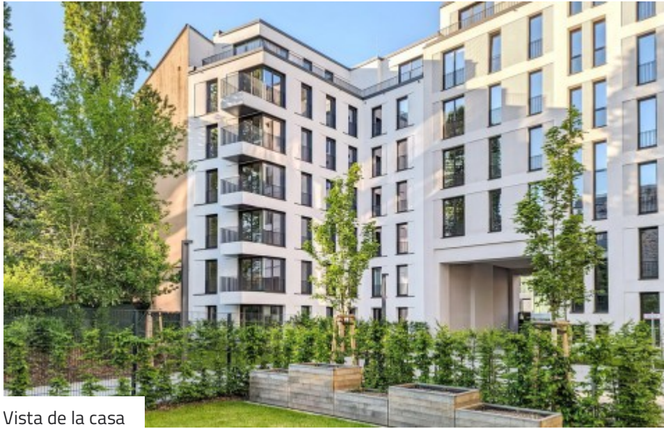
Vista de la casa