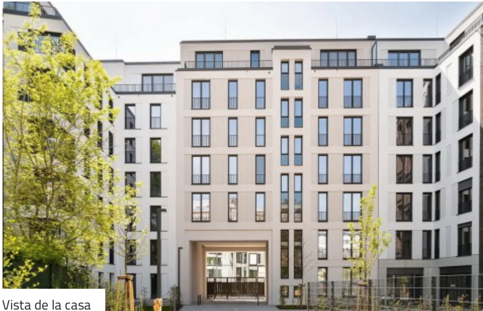
Vista de la casa