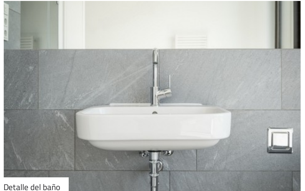
Detalle del baño