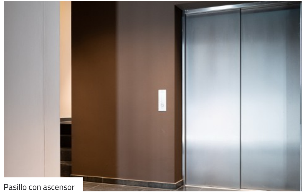
Pasillo con ascensor