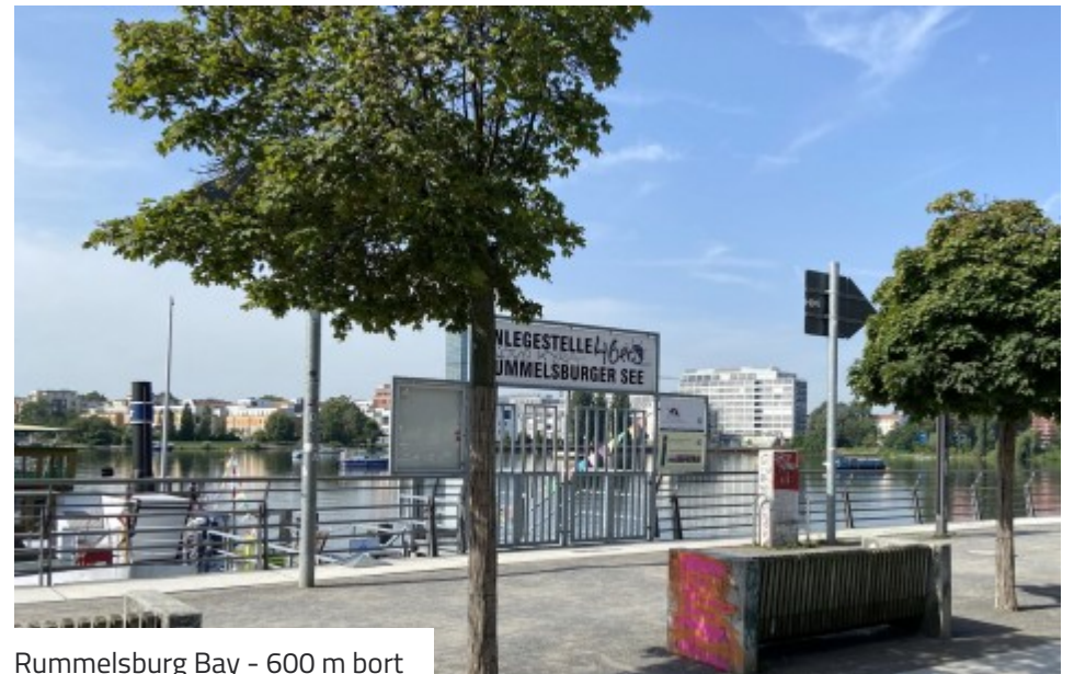
Rummelsburg Bay - 600 m bort