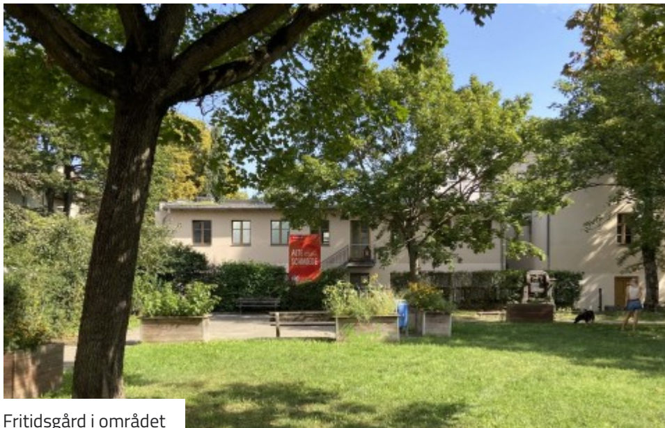
Fritidsgård i området