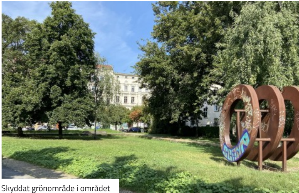
Skyddat grönområde i området