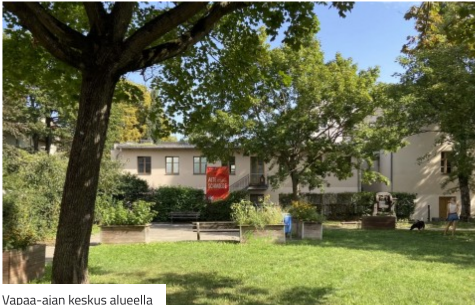
Vapaa-ajan keskus alueella