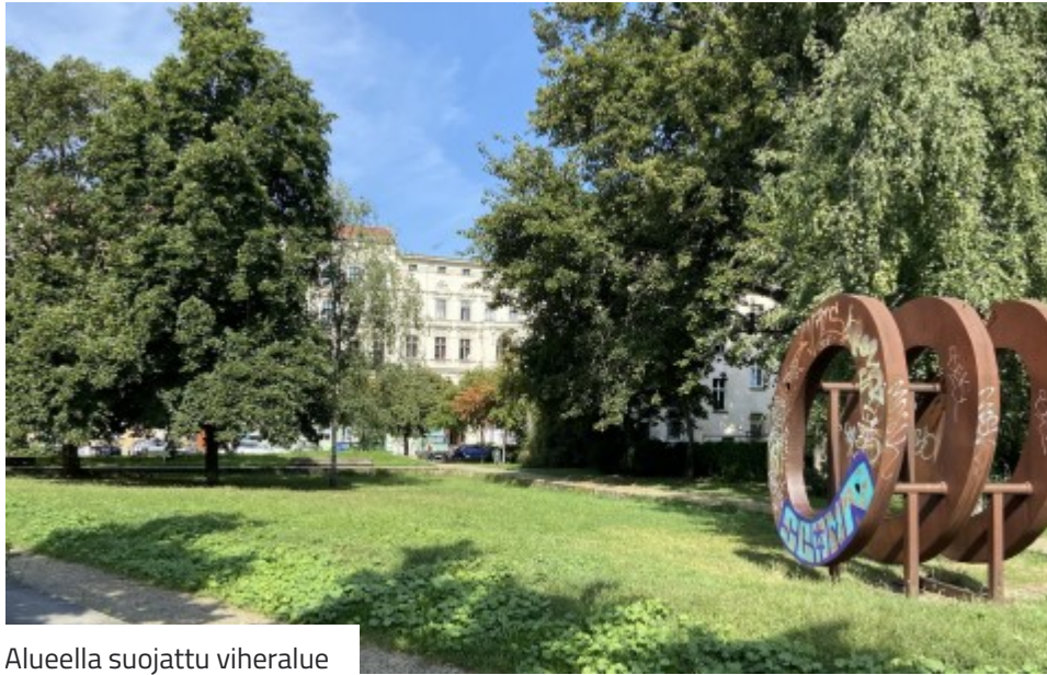
Alueella suojattu viheralue