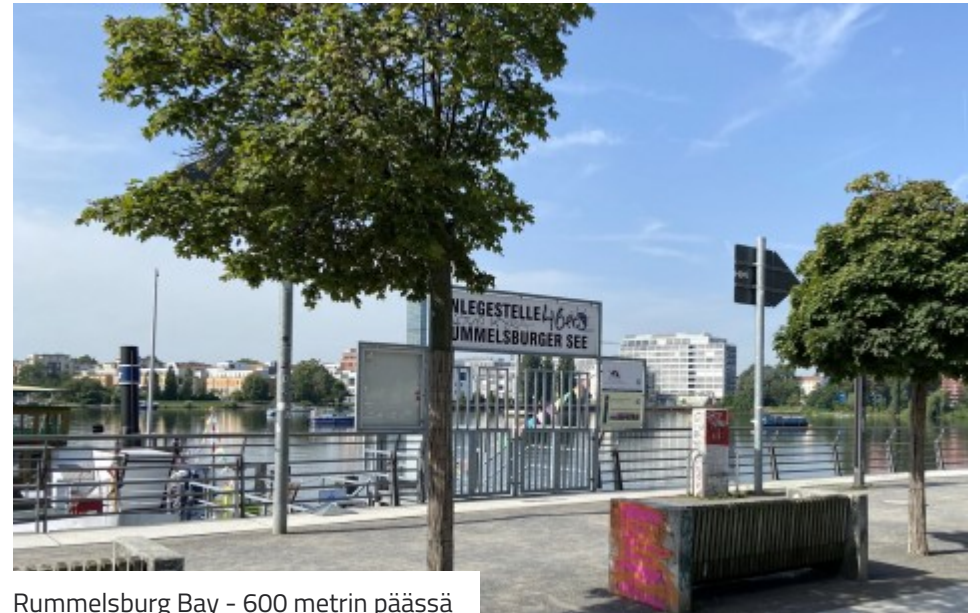
Rummelsburg Bay - 600 metrin päässä