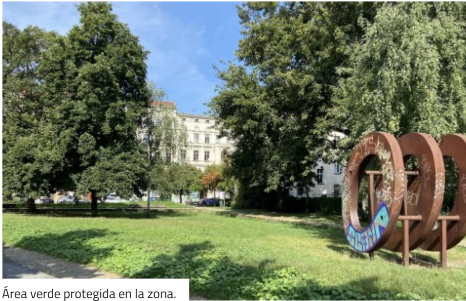
Área verde protegida en la zona.