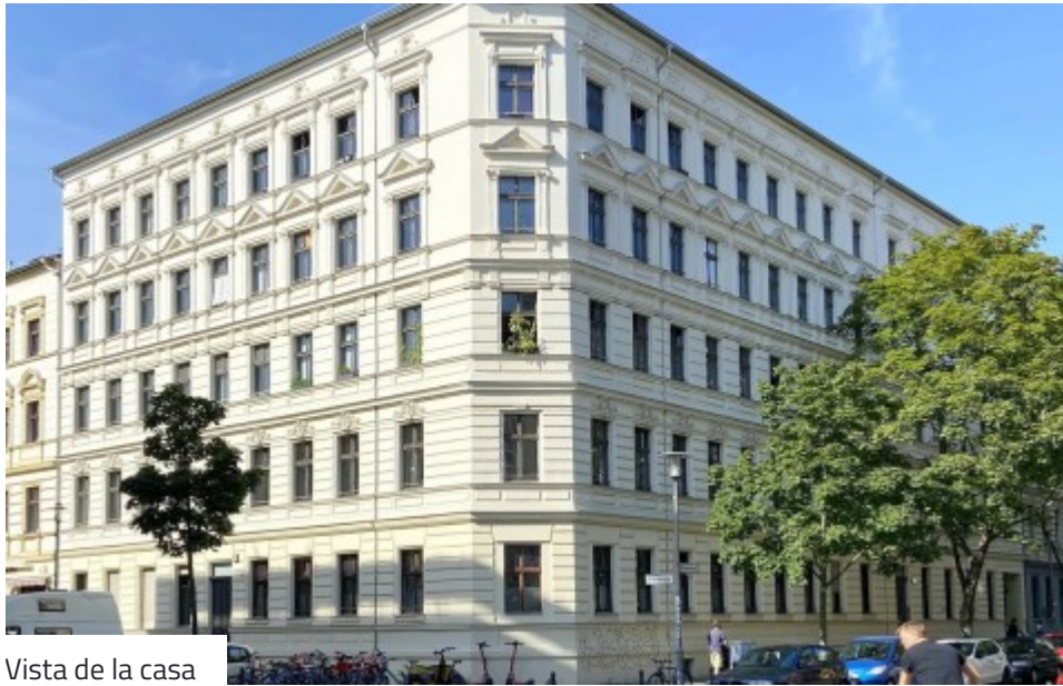
Vista de la casa