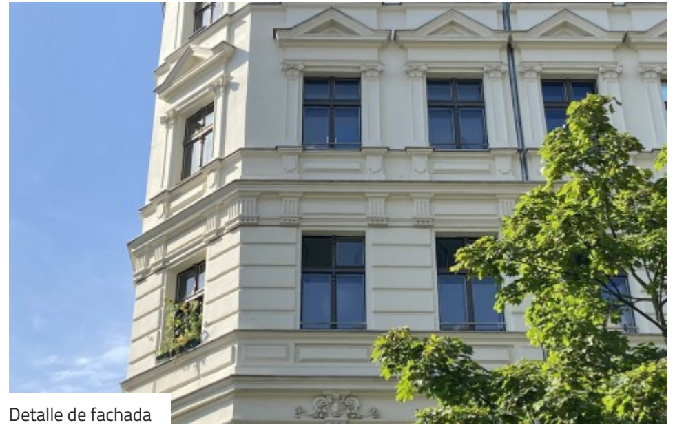
Detalle de fachada