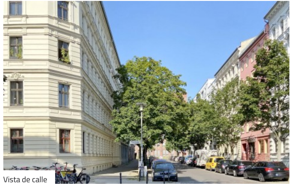
Vista de calle