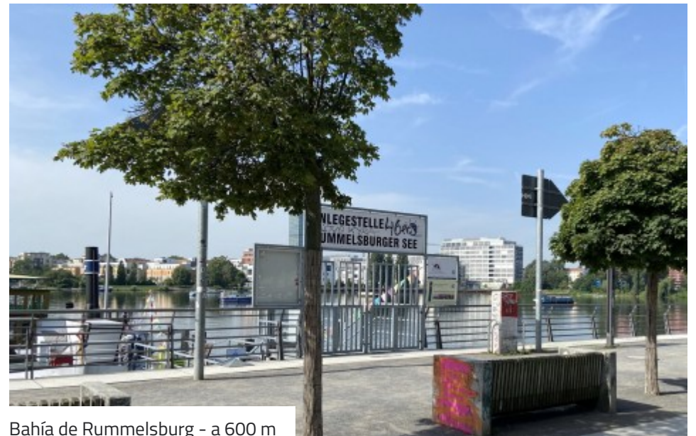
Bahía de Rummelsburg - a 600 m