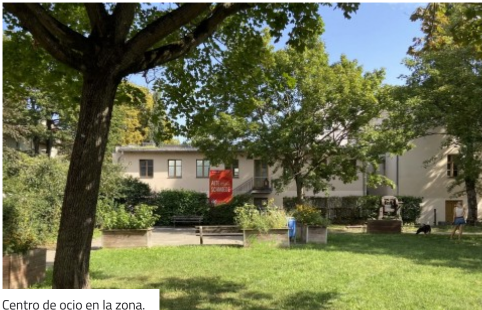
Centro de ocio en la zona.