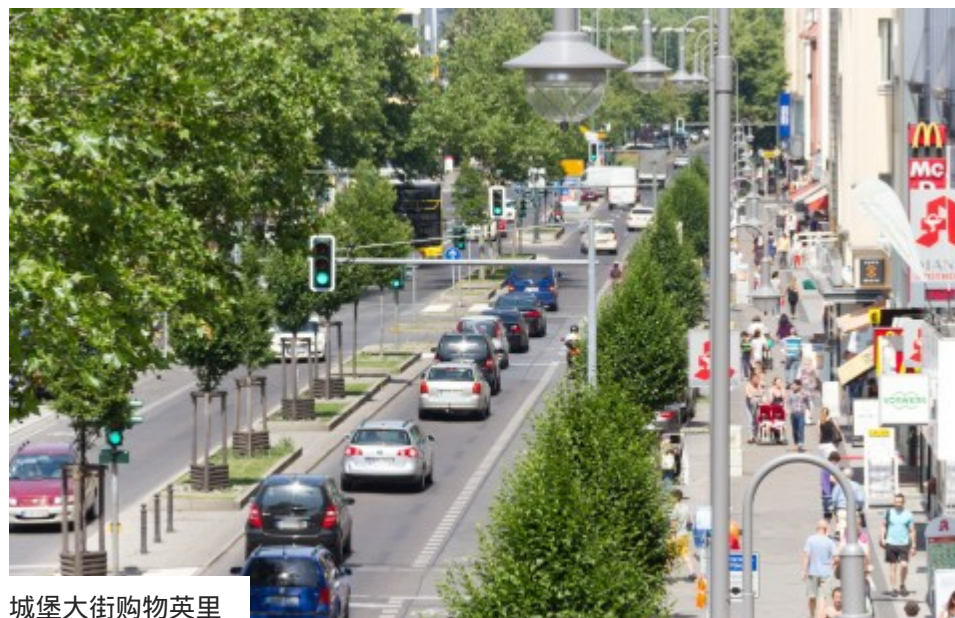
城堡大街购物英里