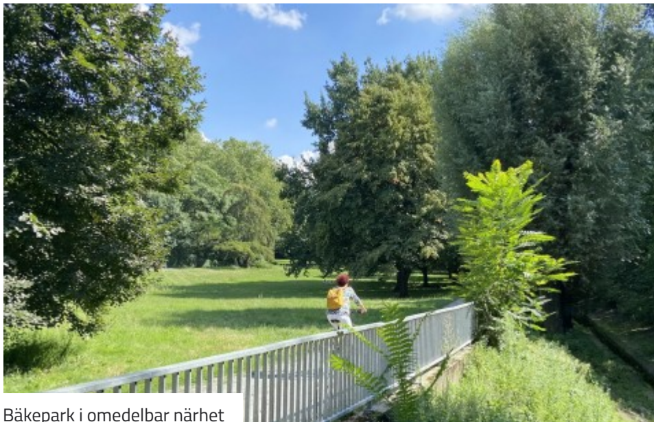
Bäkepark i omedelbar närhet