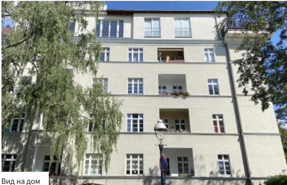
Вид на дом