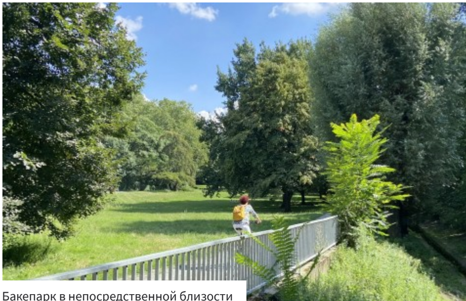
Бакепарк в непосредственной близости