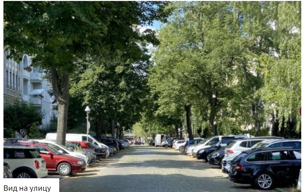
Вид на улицу