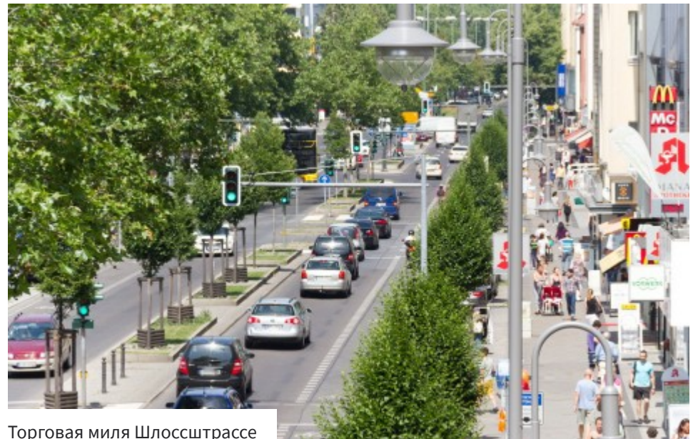
Торговая миля Шлосштрассе