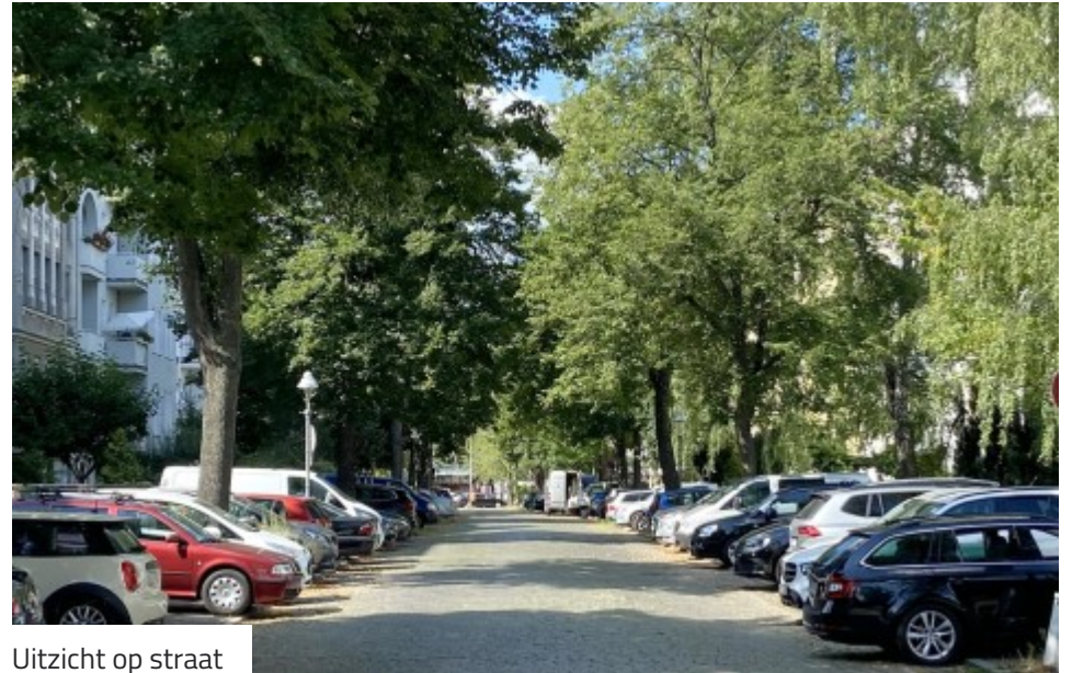
Uitzicht op straat