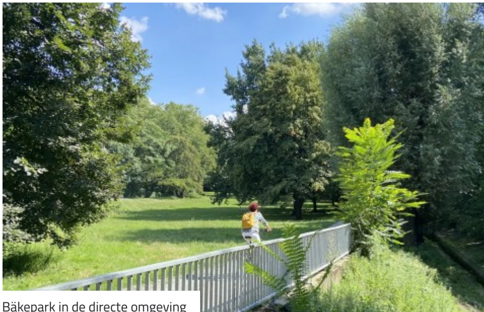
Bäkepark in de directe omgeving