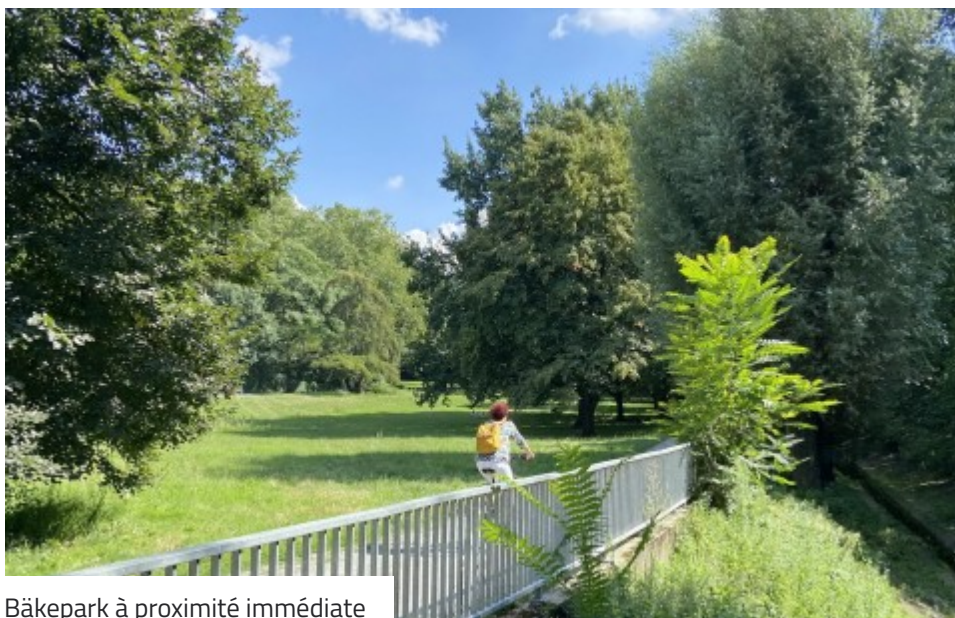
Bäkepark à proximité immédiate