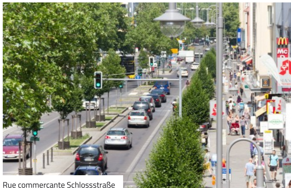
Rue commerçante Schlosstraße