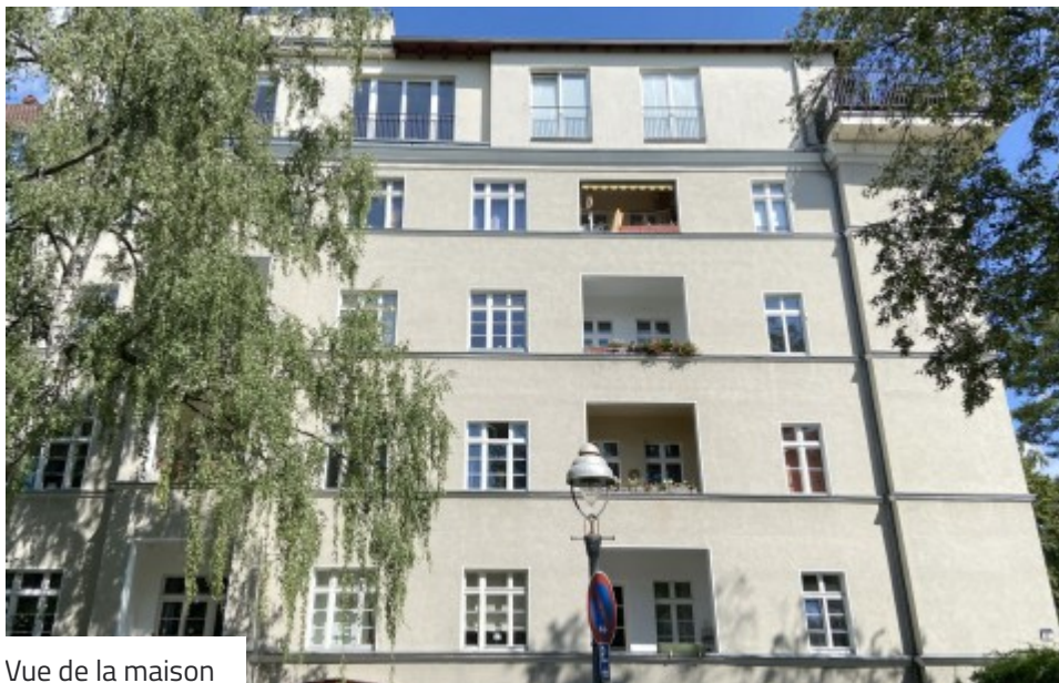
Vue de la maison