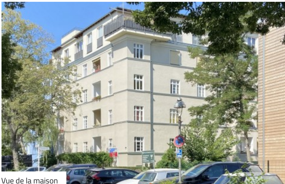
Vue de la maison