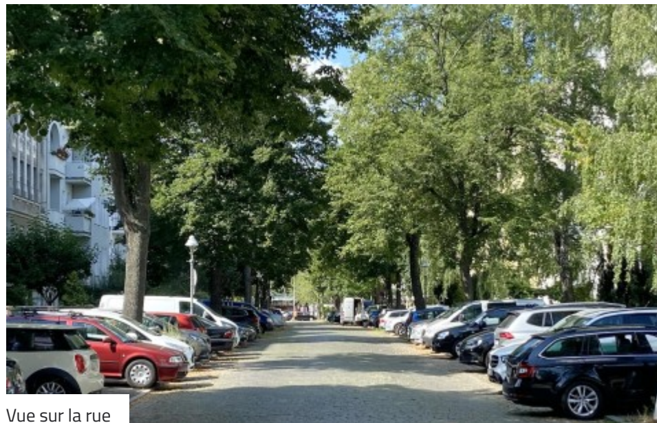
Vue sur la rue