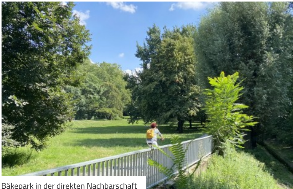
Bäkepark in der direkten Nachbarschaft