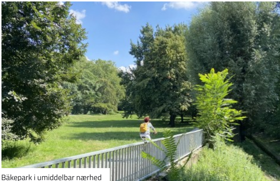
Bäkepark i umiddelbar nærhed