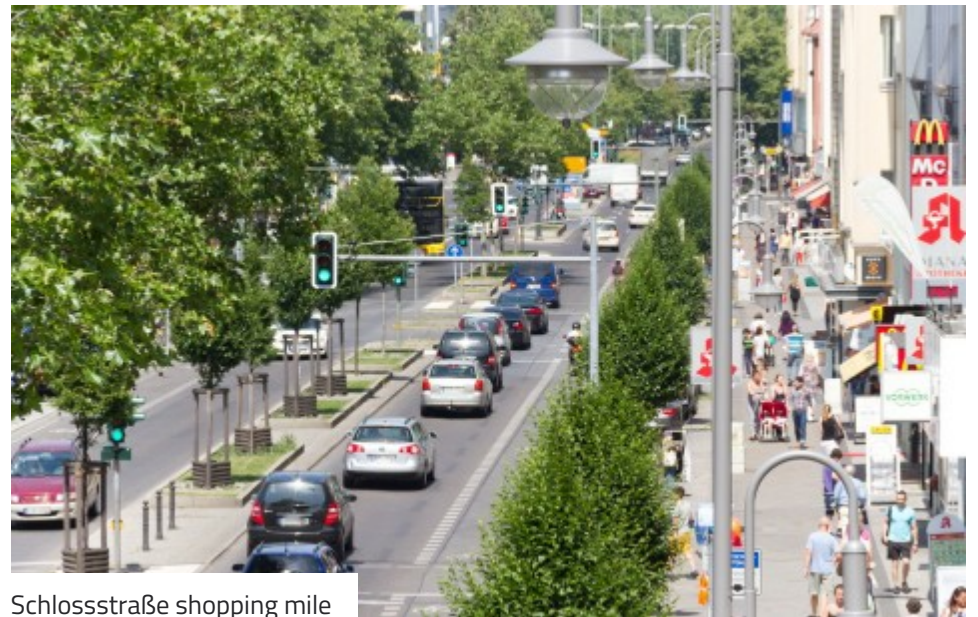
Schlossstraße shopping mile