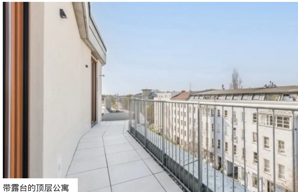
带露台的顶层公寓