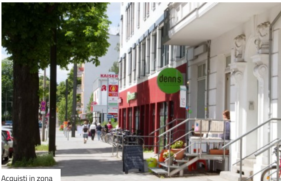
Acquisti in zona