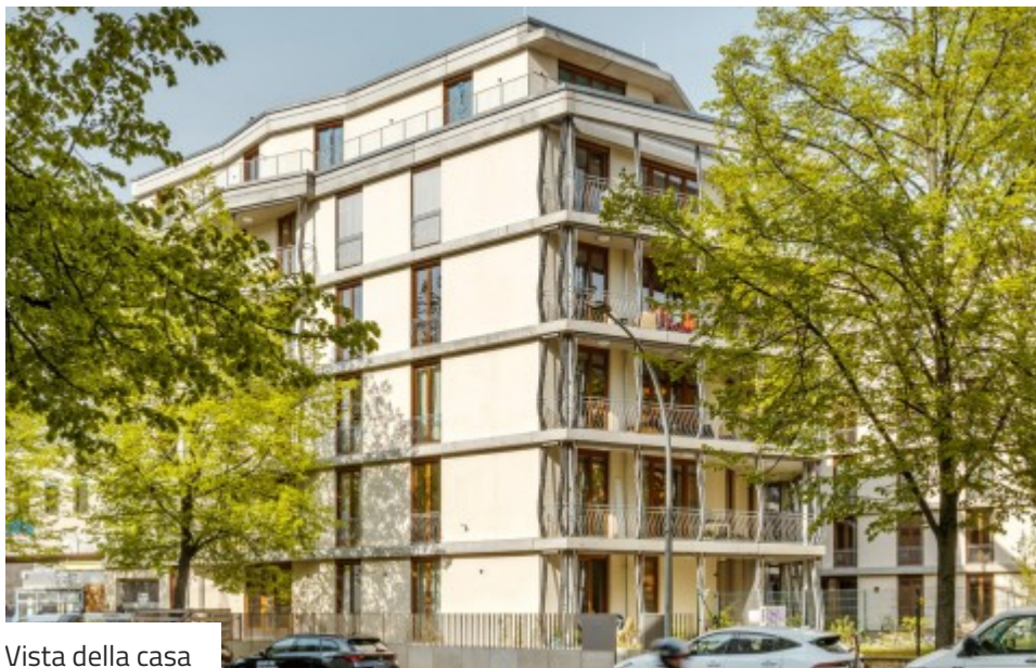
Vista della casa