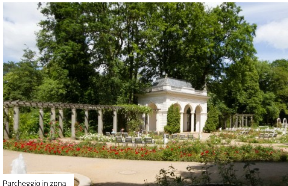
Parcheggio in zona