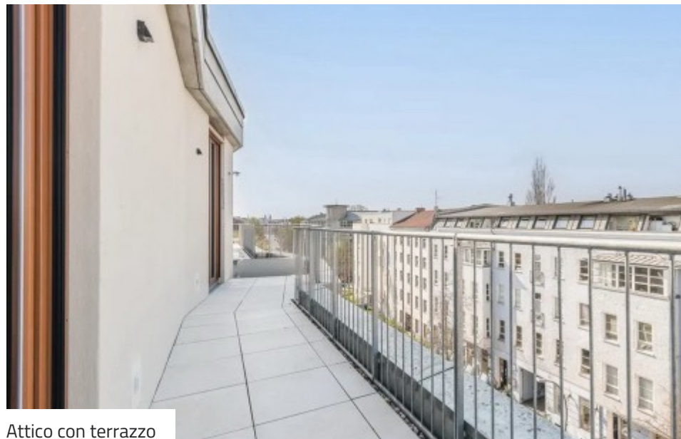
Attico con terrazzo