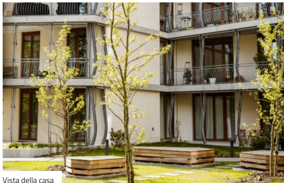
Vista della casa