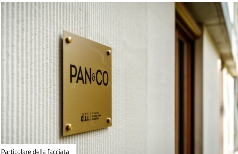
Particolare della facciata