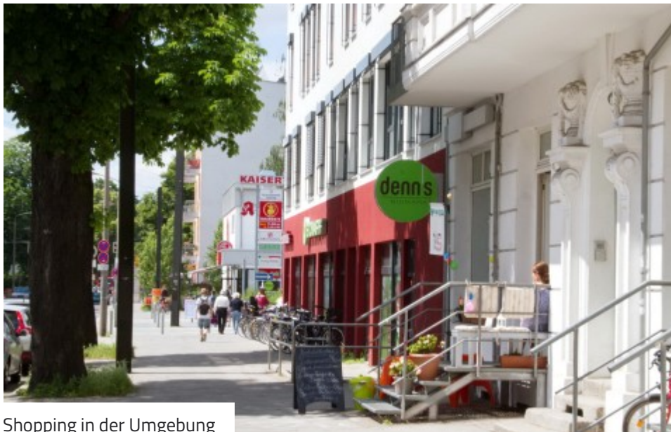
Shopping in der Umgebung