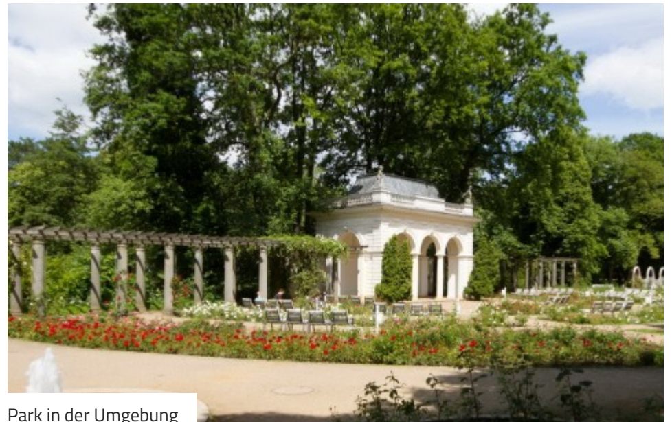
Park in der Umgebung