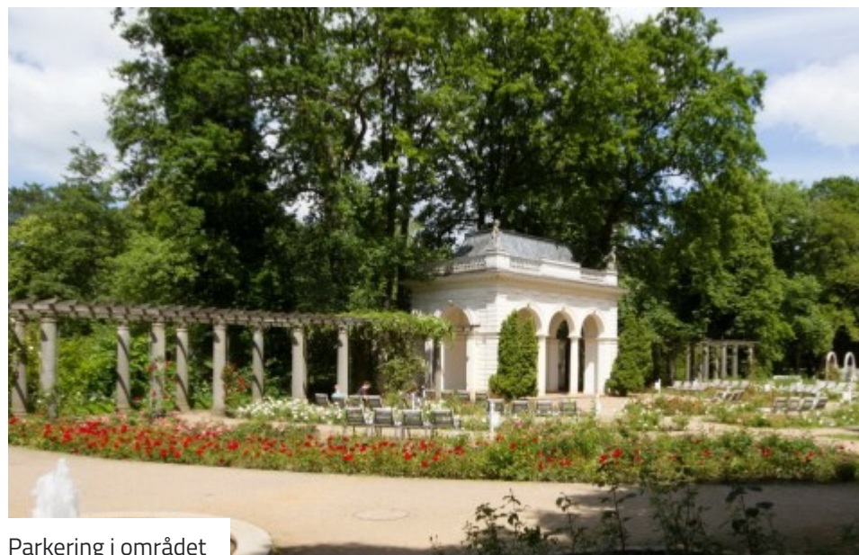
Parkering i området