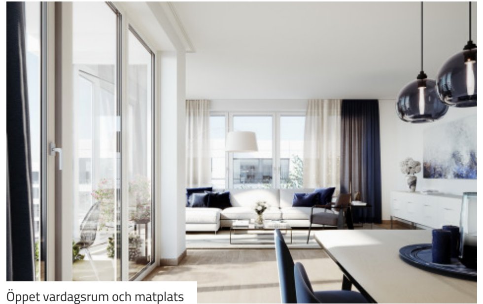
Öppet vardagsrum och matplats