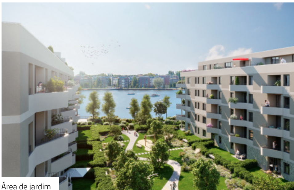
Área de jardim