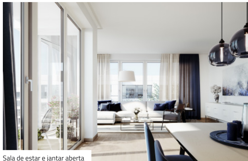
Sala de estar e jantar aberta