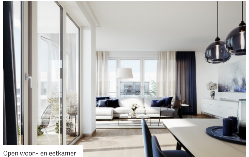
Open woon- en eetkamer