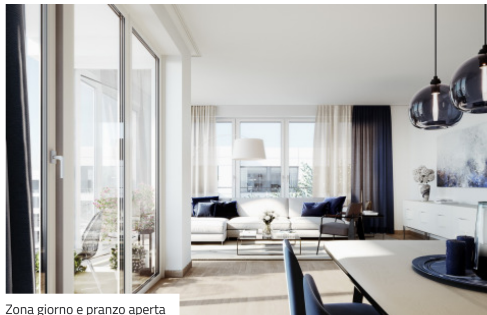
Zona giorno e pranzo aperta