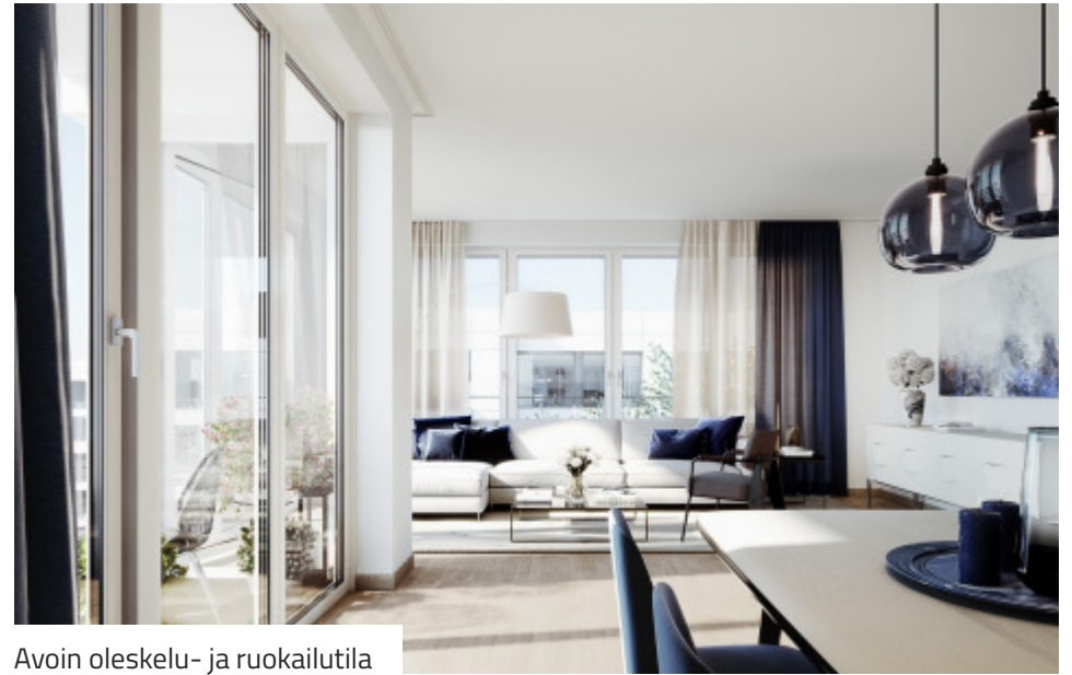
Avoin oleskelu- ja ruokailutila