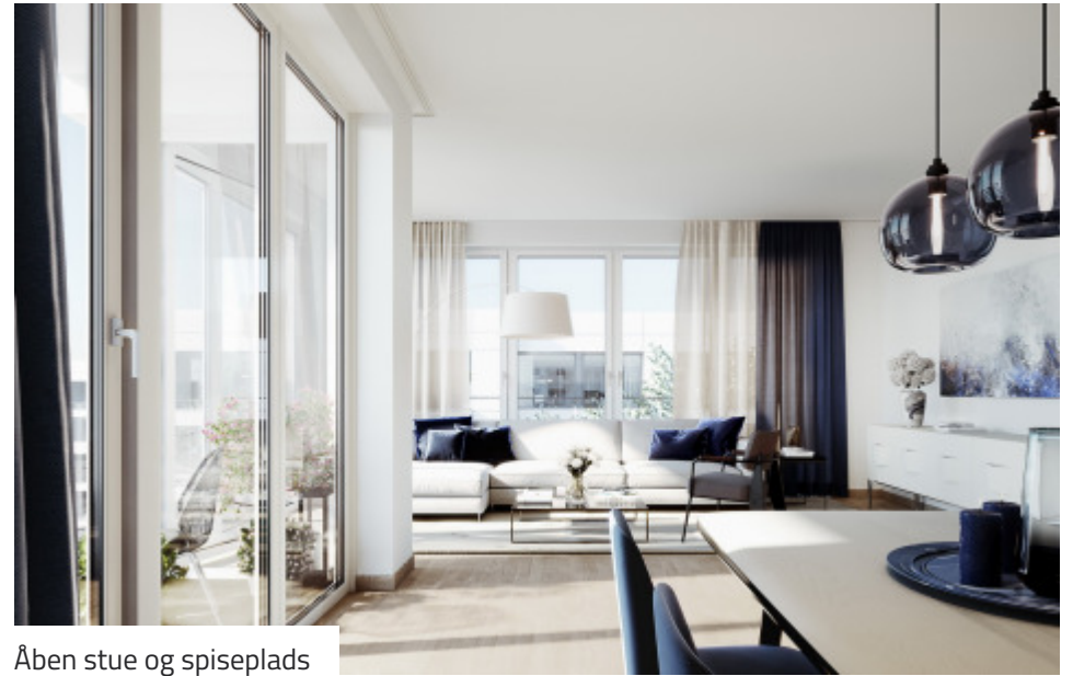
Åben stue og spiseplads