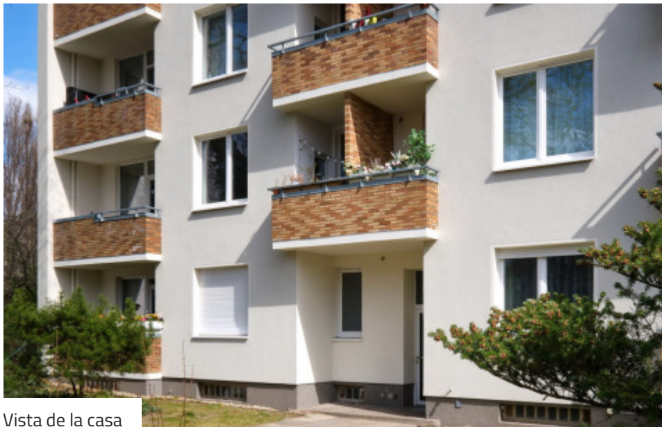
Vista de la casa