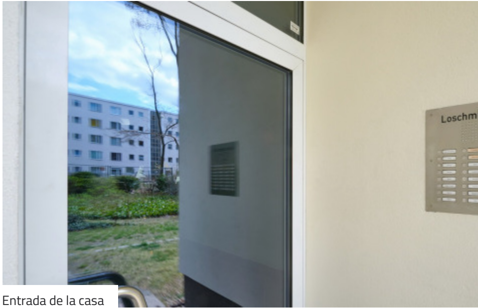
Entrada de la casa