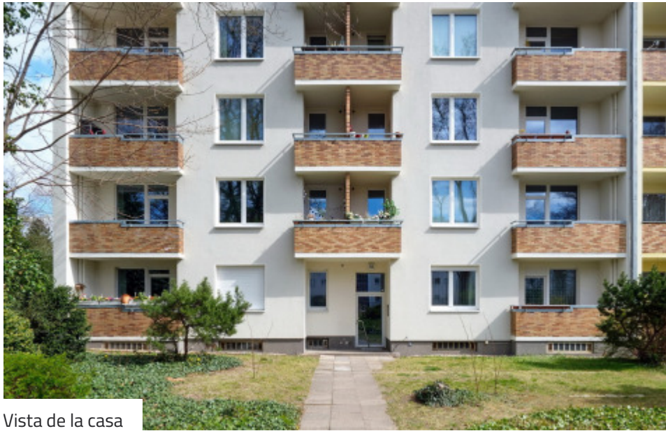
Vista de la casa