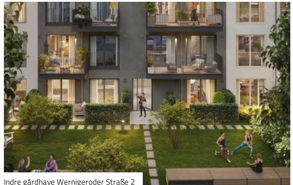
Indre gårdhave Wernigeroder Straße 2