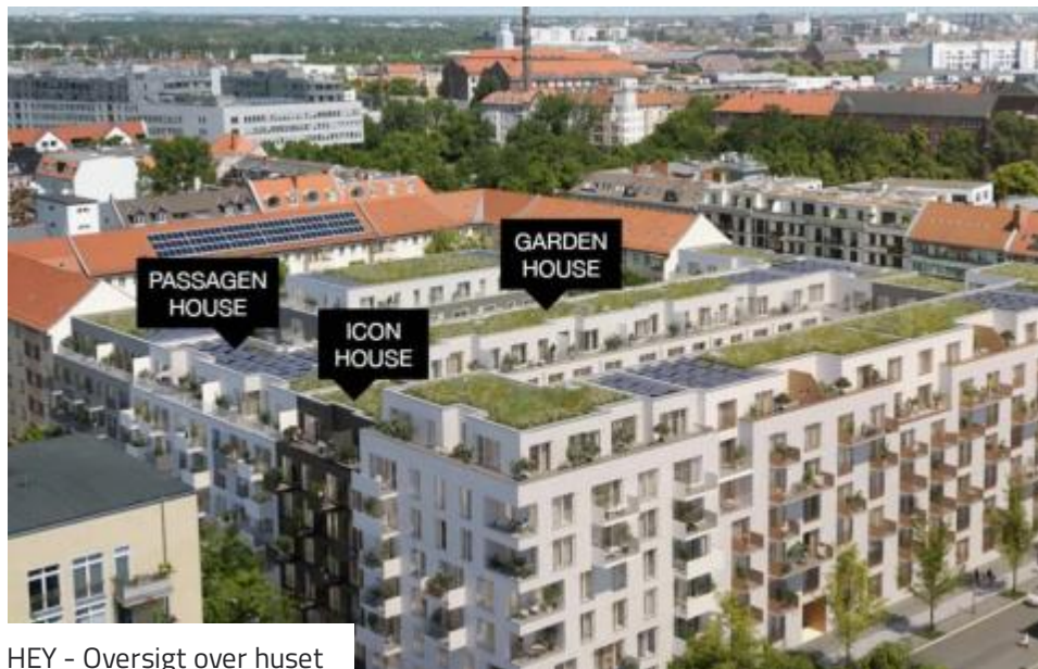
HEY - Oversigt over huset